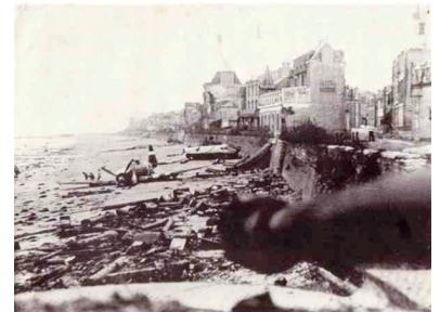
La plage de Saint Aubin sur Mer après le débarquement